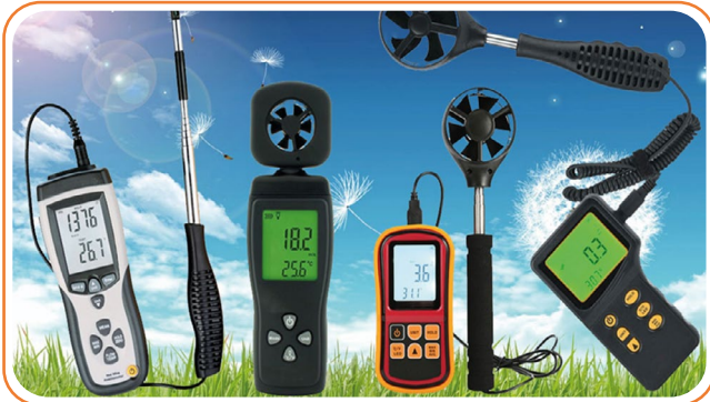
Рис. 1. Анемометры высокого разрешения

Терморегуляция птицы меняется по мере роста и смены перьевого покрова. В первые недели жизни цыплята не имеют перьевого покрова, так как у современных кроссов бройлеров оперение происходит на четвертой неделе. Перо имеет хорошие изоляционные свойства, что позволяет птице удерживать большую часть собственного тепла. Существует определенная зависимость ощущаемой птицей температуры по мере ее роста и скорости движения воздуха над ней, при средней относительной влажности воздуха, равной 50%. В таблицах 2 и 3 показано, на сколько градусов Цельсия снижается ощущаемая птицей температура по отношению к температуре воздуха, фиксируемой в птичнике, при прохождении над ней воздуха со скоростью 1 и 2 м/с. Так работает эффект охлаждения ветром, или Windchill эффект.